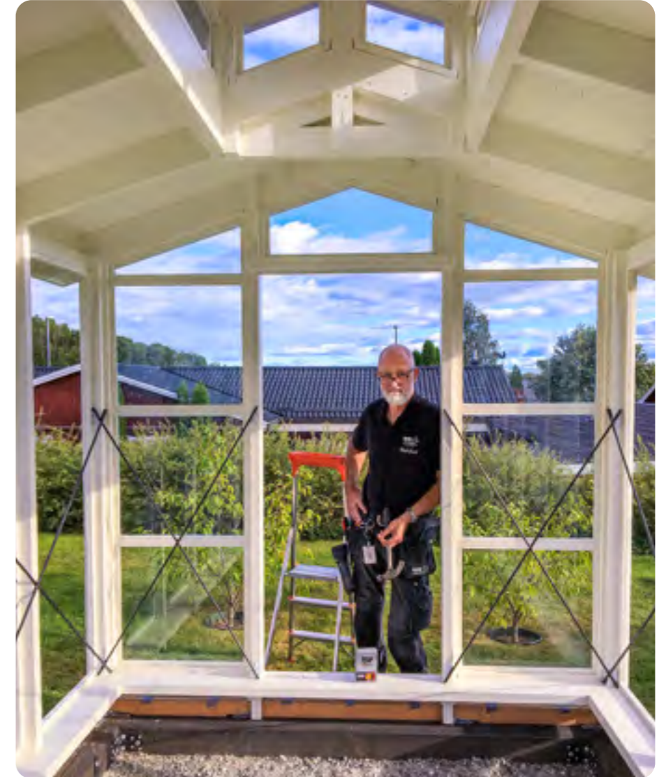
Orangeriet blir luftigt och fint.