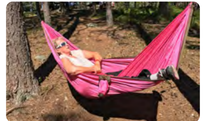
När gruppen gick från Trummelsberg till Landsberget, passade några på att vila sig i de sköna hängmattorna som finns vid Landsberget.