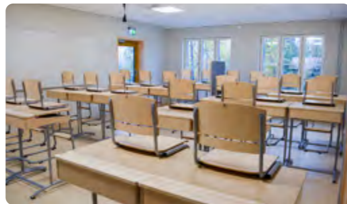
I Lindhallen finns även lektionssalar för Lindgårdsskolans elever i år 4-6.