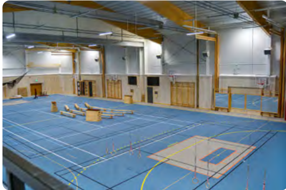
Sporthallen har fullstora mått och är fullt utrustad för idrottsundervisning och olika sporter.

-Det har varit en lång process även om själva bygget har gått fort, så det är roligt att sporthallen äntligen är färdig.