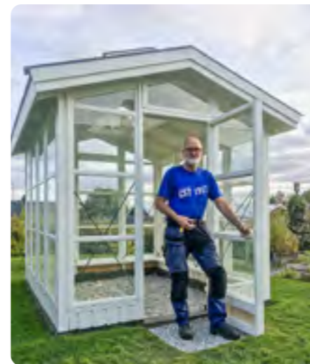
Nästan klart, bara golvet och det elektriska kvar till nästa år.