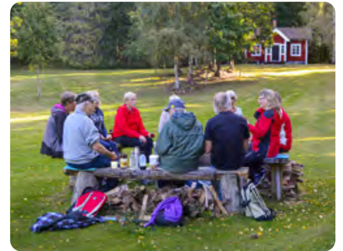
Kaffestund och vila vid Lindbostugan.