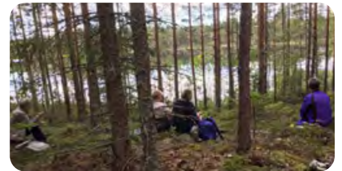
Fikapaus vid Dammsjön i Ombenning, vid en tidigare vandring.