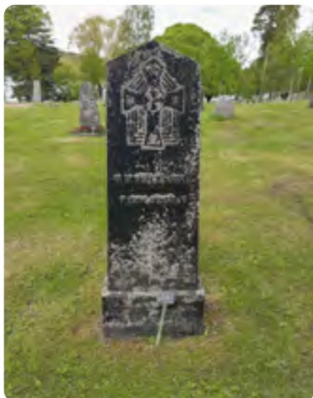
Grav med enbart grundskötsel