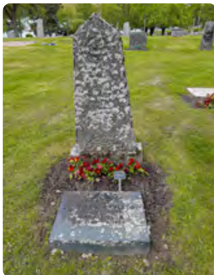
Skötsel med plantering