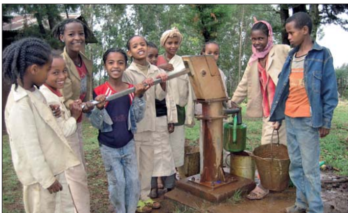
Barn pumpar vatten ur den nya brunnen som byggts genom projektet i Calaki i Etiopien.

Församlingen har två utbytesstudenter från Brasilien på besök den 17/3 - 4/4.