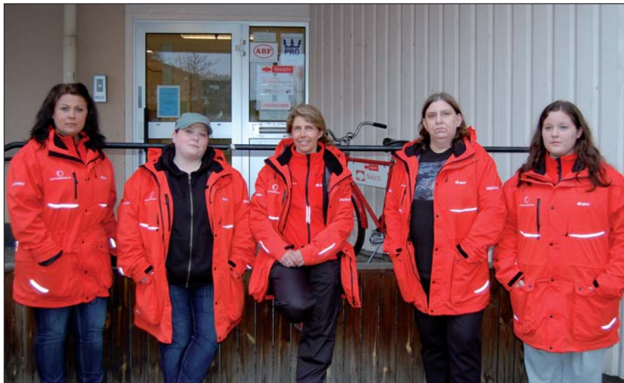
Några av nattvandrarerna i Fagersta som var ute och vandrade under Våryran.

Nu har det blivit mörkt och några vandrare tar en extra tur i Vilhelminaparken innan kvällens nattvandring avslutas. Inga allvarliga saker har inträffat bland ungdomar på stan den här kvällen, men nattvandrarerna har i alla fall varit på plats och förhoppningsvis förmedlat trygghet till de ungdomar som de har mött under kvällen.