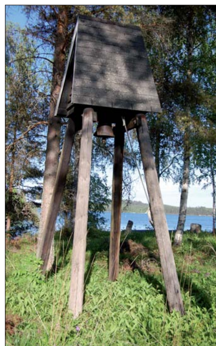
Klockstapeln i Brandbo markerar ut platsen där Valums kapell stod på 1300-talet.

Innanför patronsläktaren är ett litet museum inrättat. Här finns ett oblatjärn och kollektåvar från tidigt 1700-tal.