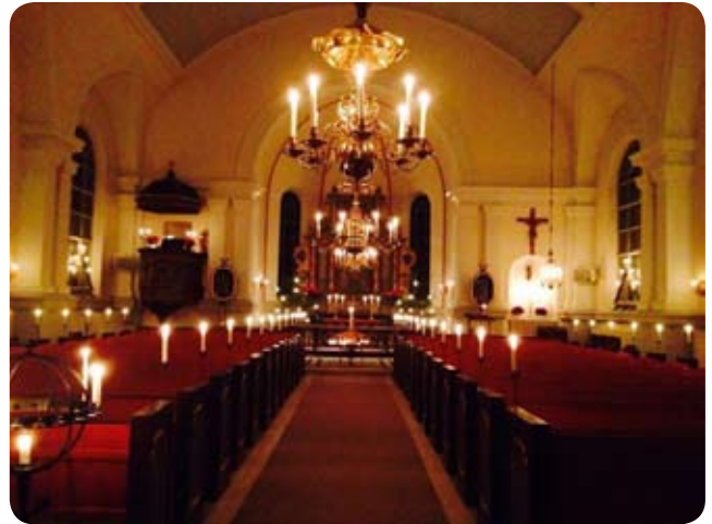
Västervåla kyrka upptänd med många levande ljus inför julottan.

kl 15 Gudstjänst i Brukskyrkan med julens sånger och psalmer.